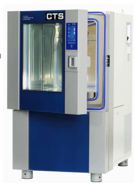
Version v17 fluide frigorigère 1 er étage R452A Présentée avec l'option hublot