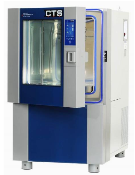
Version v17 fluide frigorigère 1 er étage R452A Présentée avec l'option hublot